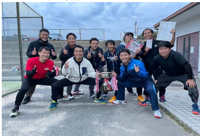
I部 優勝 ながれものA